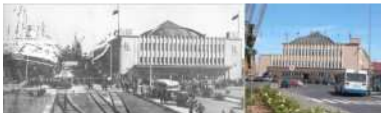
Dworzec Morski przed wojną i dziś

Koszt przywrócenia stanu posiadania miasta z sierpnia 1939 r. – według cen bieżących (luty 1946 r.) wyniósł 227.656.263 zł. Budżet zwyczajny miasta na rok budżetowy 1946 wyniósł ok. 168 mln. zł (około 74 % kosztów odbudowy).